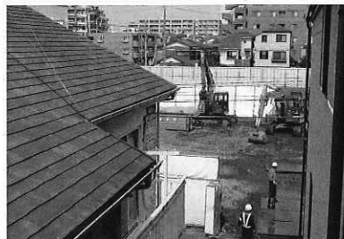
被害を訴える住民の家の2階から見た解体工事現場